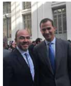
23 de noviembre de 2015

Igualmente, se expuso a Su Majestad el Rey Felipe VI el proyecto de creación del Clúster Marítimo Iberoamericano, mostrando el Rey de España su apoyo y máximo interés.