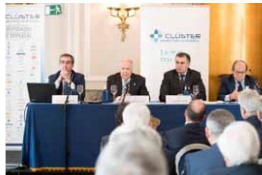
34ª ASAMBLEA GENERAL 27 de noviembre de 2017

El Comité Ejecutivo se ha reunido en las siguientes ocasiones, también desde 2014: