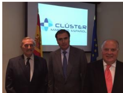
Presidente en funciones, Presidente y Presidente de Honor tras la 26ª Asamblea del CME.